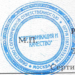
Схема сертификации: 1с.